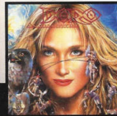
ANGELS NEVER DIE (1993)