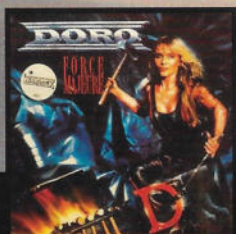
FORCE MAJEURE (1989)

Bohužel ne. Jsem neustále na turné, ale musím říci, že mi to strašně moc chybí – mít nějaké zvíře. Se zvířaty jsem vyrůstala, s koňmi, psy. Jako dítě jsem jezdila na koni a také jsem chodila na jezdecké hodiny na statek, kterých je kolem Düsseldorfu, kde jsem vyrůstala, mnoho. Jako dítě jsem si myslela, že jezdím perfektně, ale pak jsem po čase jezdila znovu a nějak to vůbec nešlo... (smích) Navíc když mě čeká turné, mám samozřejmě smluvní povinnost se nezranit. Tzn. nesmím například lyžovat, jezdit na koni a podobné nebezpečné věci. Ale chybí mi to, opravdu... Píseň z nové desky „Heavenly Creatures“ je věnována zvířatům. Už delší dobu jsem toto téma nosila v hlavě. Jsem ve spojení s mnoha lidmi, kteří pomáhají zvířatům v různých hodně špatných situacích. Dokonce jsem adoptovala dva koně, kteří mají nyní krásný život na statku v Rakousku, blízko Salcburku. Už se na nich nedá jezdit a užívají si jen krásný dýchod.