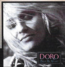
TRUE AT HEART (1991)